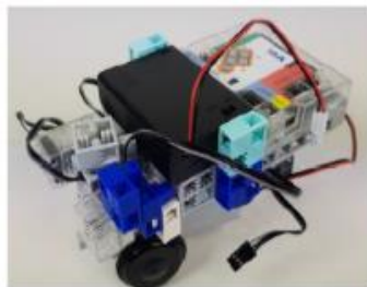
Voiture autonome basique