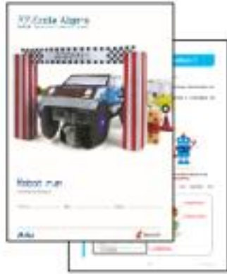
1 livret robotique format A4