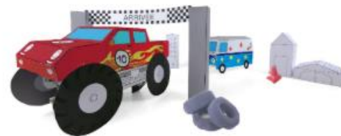
Voiture autonome une fois décorée