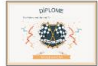
1 diplôme pour chaque élève