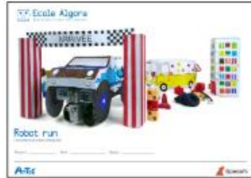
1 livret activités artistiques format A3